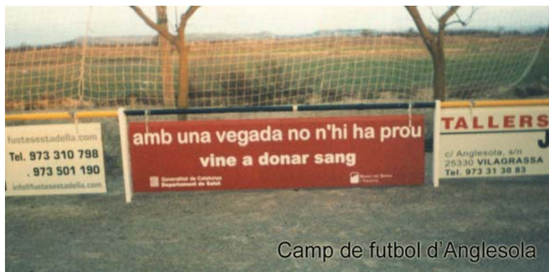
Camp de futbol d'Anglesola

addicional. Tant és així que ens agradaria molt retrobar-vos, el proper dia... a Anglesola!