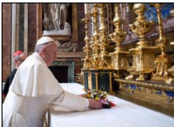
D.G.H Phan-xi-cô tại Nhà Thờ Đức Bà Cả ngày 15-03-2013

Đức Tân Thánh Cha của chúng ta, Đức Giáo Hoàng Phan-xi-cô đã đến Đại Thánh Đường Đức Bà Cả trước tiên trong buổi sáng hôm sau ngày Ngài được bầu chọn ngự trên Ngai Tòa Thánh Phêrô. Ngài đã đem dâng cho Đức Mẹ một bó hoa và dành ra một thời gian tĩnh lặng cùng với Đức Mẹ. Thật là một thời khắc tuyệt vời.