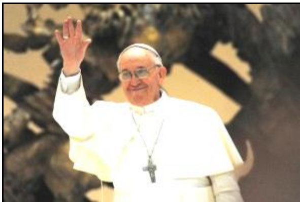
Đức Giáo Hoàng Phan-xi-cô