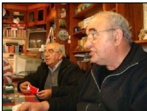
Cả hai anh em đều thuộc về Tỉnh Dòng Thánh Giê-rô-mi-nô ở Zadar.