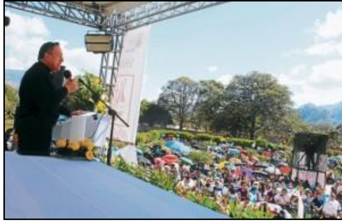
Đức Hồng Y Maradiaga ngỏ lời với Đại Hội Giới Trẻ

Giáo Hội Công Giáo ở Honduras đã tích cực hỗ trợ việc xây dựng mô hình Cây Thánh Giá. Giống như ở Mỹ Du, Đàng Thánh Giá làm cho việc lên đỉnh núi được thuận lợi hơn.