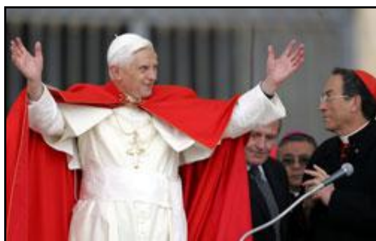
Đức Hồng Y Maradiaga cùng với Đức Giáo Hoàng Biển Đức XVI