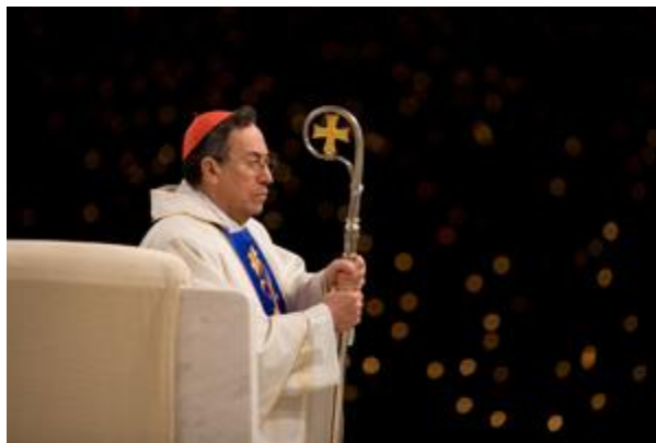
Đức Hồng Y Maradiaga của Honduras