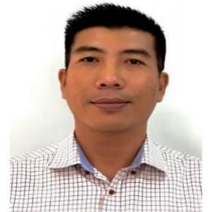
Uy Ngo Accounting Kế toán tài chính