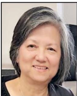
Hanh Bui Market Place Ministry Mục Vụ Thị Trường