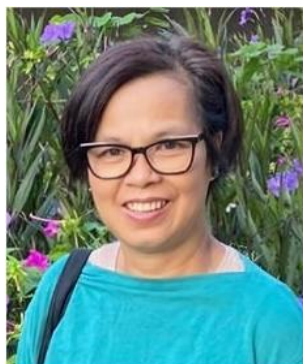
Ha Tran Market Place ministry Mục Vụ Thị trường

Các nhân sự của tổ chức Agape Fish Fund đều trong tinh thần tự nguyện bất vụ lợi và cùng chung khả năng phục vụ để phát triển Hội Thánh Chúa tại quê nhà, nhất là các Hội Thánh người Dân Tộc tại miền Bắc